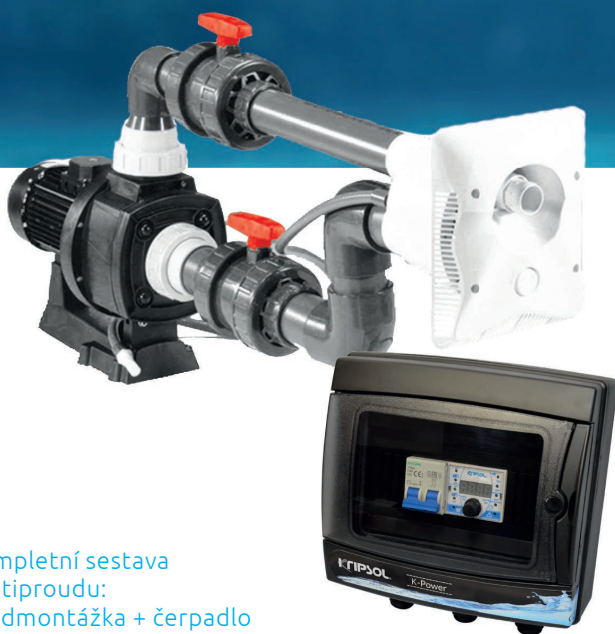
Kompletní sestava protiproudu: předmontážka + čerpadlo