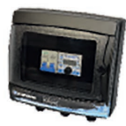
K-POWER pro protiproud